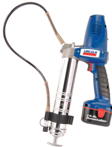
Рис.3 Аккумуляторный смазочный шприц тип Power Luber

- «Для улучшения потребительских свойств автомобилей КАМАЗ с 2009 года начала опциональная установка АЦСС компании Lincoln на опытно-промышленную партию автомобилей по заказам потребителей. В научно-техническом