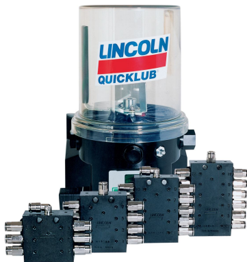
Рис.1 Насос и питание системы QuickLub

Поэтому практически все производители современной техники устанавливают на свою продукцию автоматические централизованные системы смазки (АЦСС). Компания Lincoln является поставщиком АЦСС для ведущих зарубежных и отечественных производителей строительной и горнодобывающей техники, среди них: Liebherr, Volvo, Caterpillar, Komatsu, Terex, Viscurus, ПО «БелАЗ», ОАО «Дробмаш», ЗАО «Машиностроительная корпорация «Уралмаш», ЗАО «Новокраматорский машиностроительный завод» (НКМЗ), ООО «ИЗ-Картекс» (Группа ОМЗ), ОАО «КамАЗ» и многие другие.