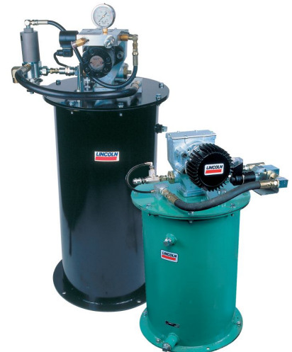
Рис.4 Бочковые насосы тип Flow Master для карьерной техники.

- «За время эксплуатации карьерных экскаваторов ЭЖГ-10 АЦСС Lincoln установленные на них зарекомендовали себя с положительной стороны. Общие показатели экономической