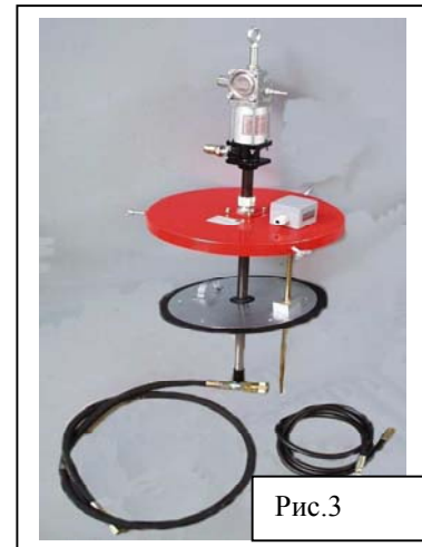
Рис.3 Общий вид бочечного насоса и размещение его в машинном отделении ЭШ 15.90

Специалисты карьера AS „Narva Karjäär“ высоко оценили АСС фирмы Lincoln, установленную на шагающем экскаваторе ЭШ 15.90, и, наравне с указанными выше преимуществами применения автоматической смазочной системы, отметили также следующие положительные стороны её использования: