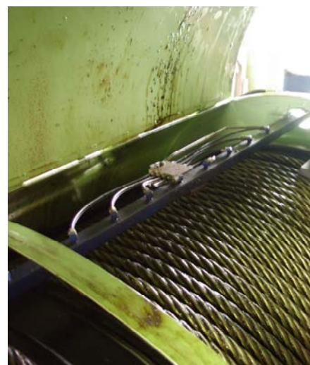
Рис.6 Смазка стального каната