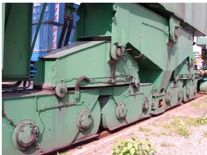
Рис. 5 Смазка механизма передвижения портового крана