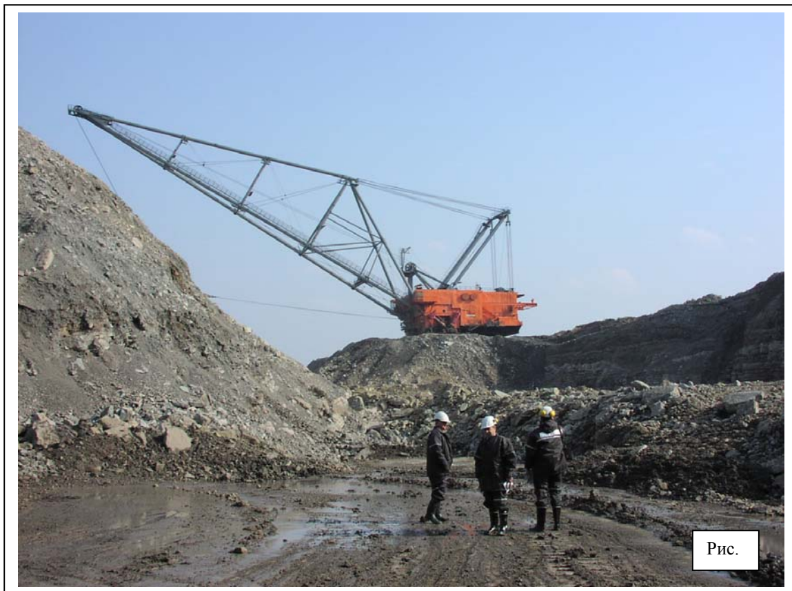
Рис.1 Шагающий экскаватор ЭШ 15.90 (заводской № 23, Июль 2002) на карьере AS „Narva Karjaar“

Целесообразность применения АСС была практически показана на землеройной и погрузочной технике. С этой целью на АС „Narva Karjaar“ (Эстония) были проведены сравнительные испытания двух шагающих экскаваторов ЭШ 15.90 (ОМЗ-Горное оборудование, Екатеринбург), один из которых (заводской № 23 ) был оснащён автоматической системой смазки фирмы Lincoln, а другой (заводской № 24 ) –штатной системой смазки.