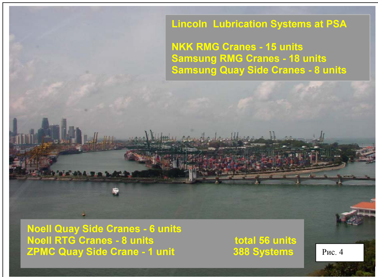
Рис. 4 Применение АСС на портовых кранах ПО Сингапур

Эффективность и целесообразность применения АСС на Подъемнотранспортном оборудовании может быть представлена маленьким фрагментом делового сотрудничества морского порта «ПО Сингапур» с фирмой Lincoln GmbH & Co. KG, где на 56-и портовых кранах установлены более 388 различных смазочных систем. Эти системы позволяют все труднодоступные и трудоёмкие пары трения смазывать во время работы.